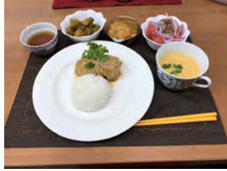
2月のインド料理 アクバル王の鶏料理、 茄子とジャガイモのサブジ