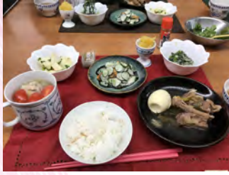
1月の健康食 スペアリブと卵のナンプラー煮