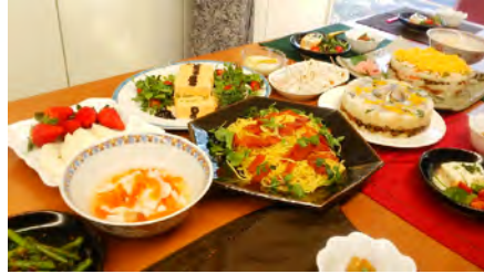
12月のインド料理 ポークカレー