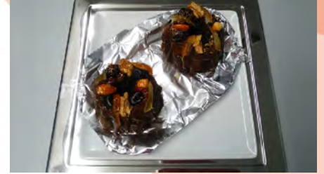
12月のパン教室 ケーキ