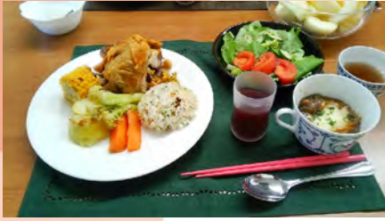
12月の健康食 スタンフォードチキン、 温野菜のアリオリソース