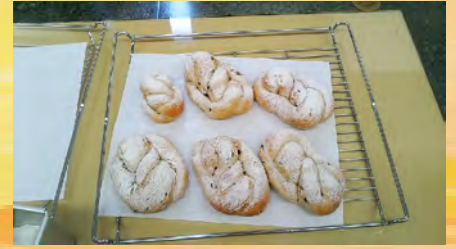
7月のパン教室 バターロール