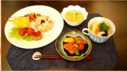
8月の健康食 卵豆腐の冷やし仕立て、 鶏ささみのちり酢浸し