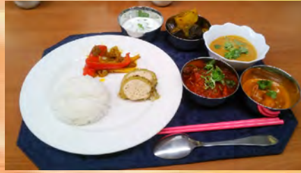
8月のインド料理 サモサ、チャナサラダ