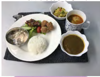
4月のインド料理 スペアリブカフェリアン