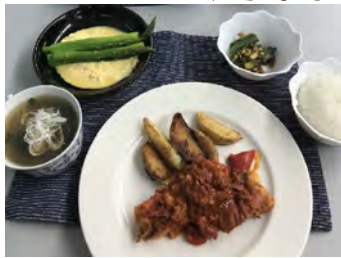
4月の健康食 鶏のソテーバスク風